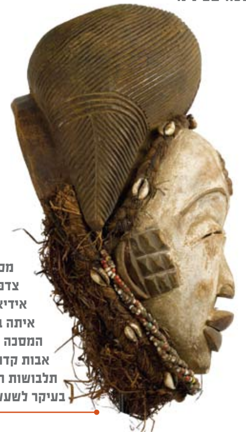
מסכת אוקויו - עץ, סיבים, פיגמנט, צדפים. המסכה מייצגת פנים אידיאליות של אישה. נהוג היה לרקוד איתה במהלך טקסי לוויות, שבהם המסכה נתפסה כהתגלמות רוחות של אבות קדומים. הרקדנים עטו על עצמם תלבושות רפיה. כיום מסכות אלו מיועדות בעיקר לשעשוע.

עוד שחג פורים מתדפק אצלנו בפתח, והמסכות יוצאות מהארונות ומהחניות כדי להיות חלק מתחפושת, בשבטים האפריקאיים נושאות עמן המסכות משמעויות שונות לגמרי ושימושים אחרים. תערוכת "המסכה שבינינו", המוצגת בגלריה ללימודי אפריקה במנדלי אלרוב בתל אביב, חוקרת את גלגוליה של המסכה האפריקאית באמצעות פריטים שונים מהיבשת. לדברי האוצרת עידית טולדנו, המסכה והטקסים המלווים אותה הם מביטוי האמונות המרהיבים ביותר של אפריקה, שם הן משמשות בעיקר בטקסי מעבר, לרוב בהקשר לחניכה לגבריות, ובטקסי קבורה. כמו כן הן מופיעות במגוון רב של נסיבות אחרות כמו בזמן הקציר, כהכנה למלחמה או סתם לשם שעשוע. המסכות האפריקאיות משמשות להעברת הידע והמורשת החברתית מדור לדור והן חלק מנטקס הכולל תלבושות, שירה, מוזיקה, ריקודים והקרבת קורבנות. האפקט הדרמטי