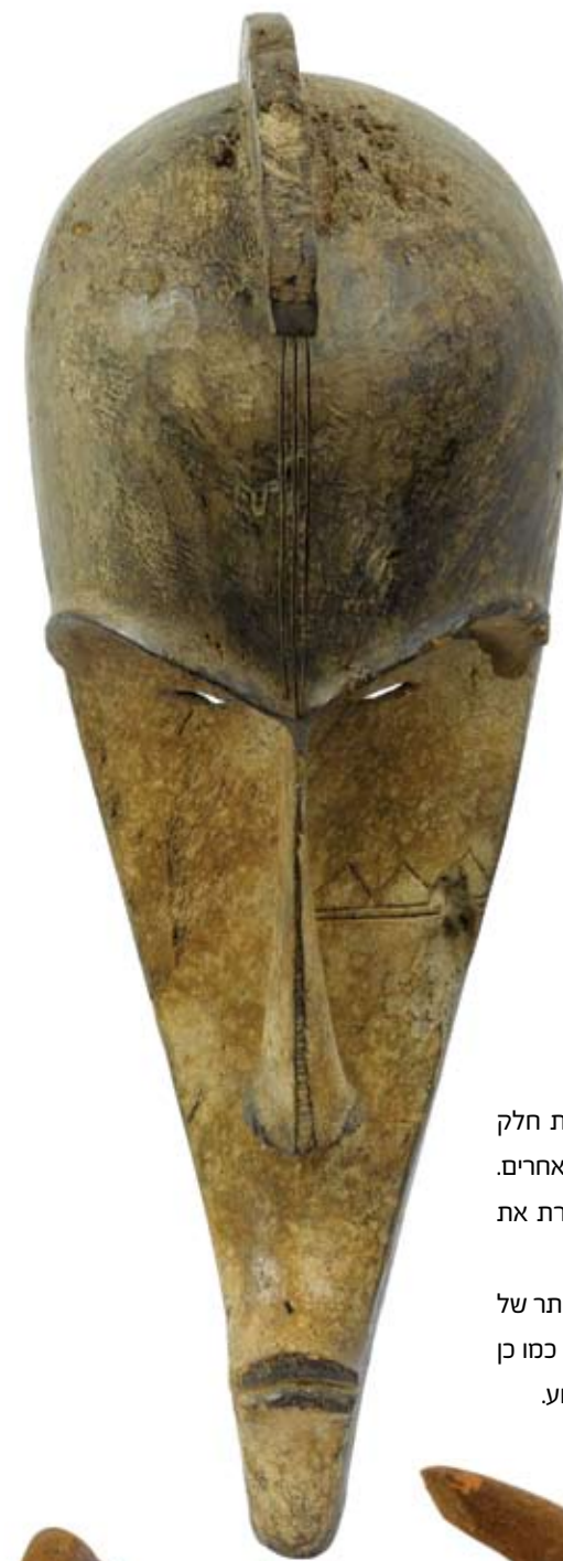
מסכת נגיל - עץ, פיגמנט. מסכה זו מייצגת מסורת של שימוש במסכות שחדלה להתקיים לפני יותר מ-60 שנה, לפיכך הידע על השימוש בה מועט. נראה כי עשו בה שימוש במהלך חניכה לאגודת גברים.