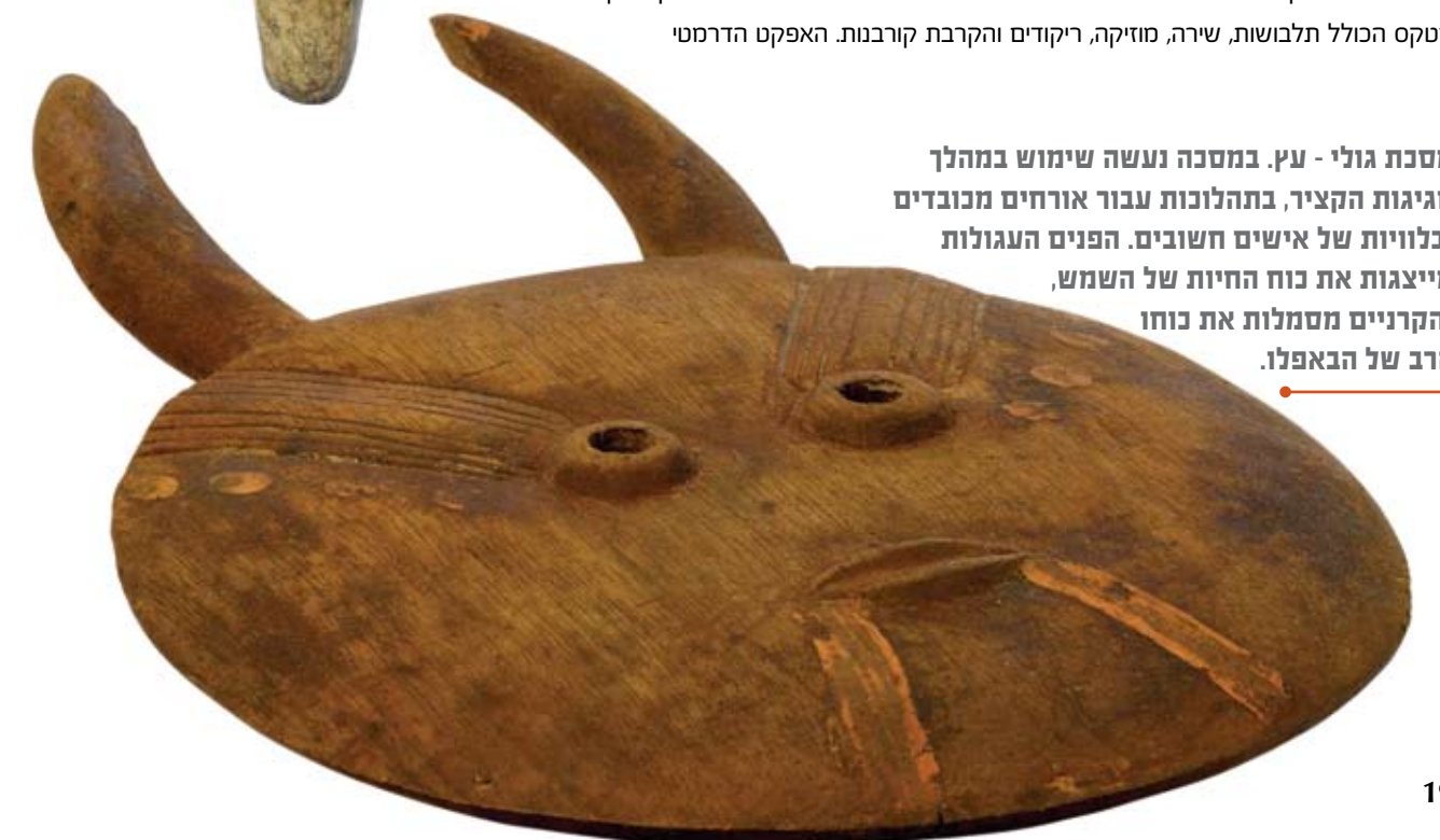
מסכת גולי - עץ. במסכה נעשה שימוש במהלך חגיגות הקציר, בתהלוכות עבור אורחים מכובדים ובלוויות של אישים חשובים. הפנים העגולות מייצגות את כוח החיות של השמש, והקרניים מסמלות את כוחו הרב של הבאפלו.