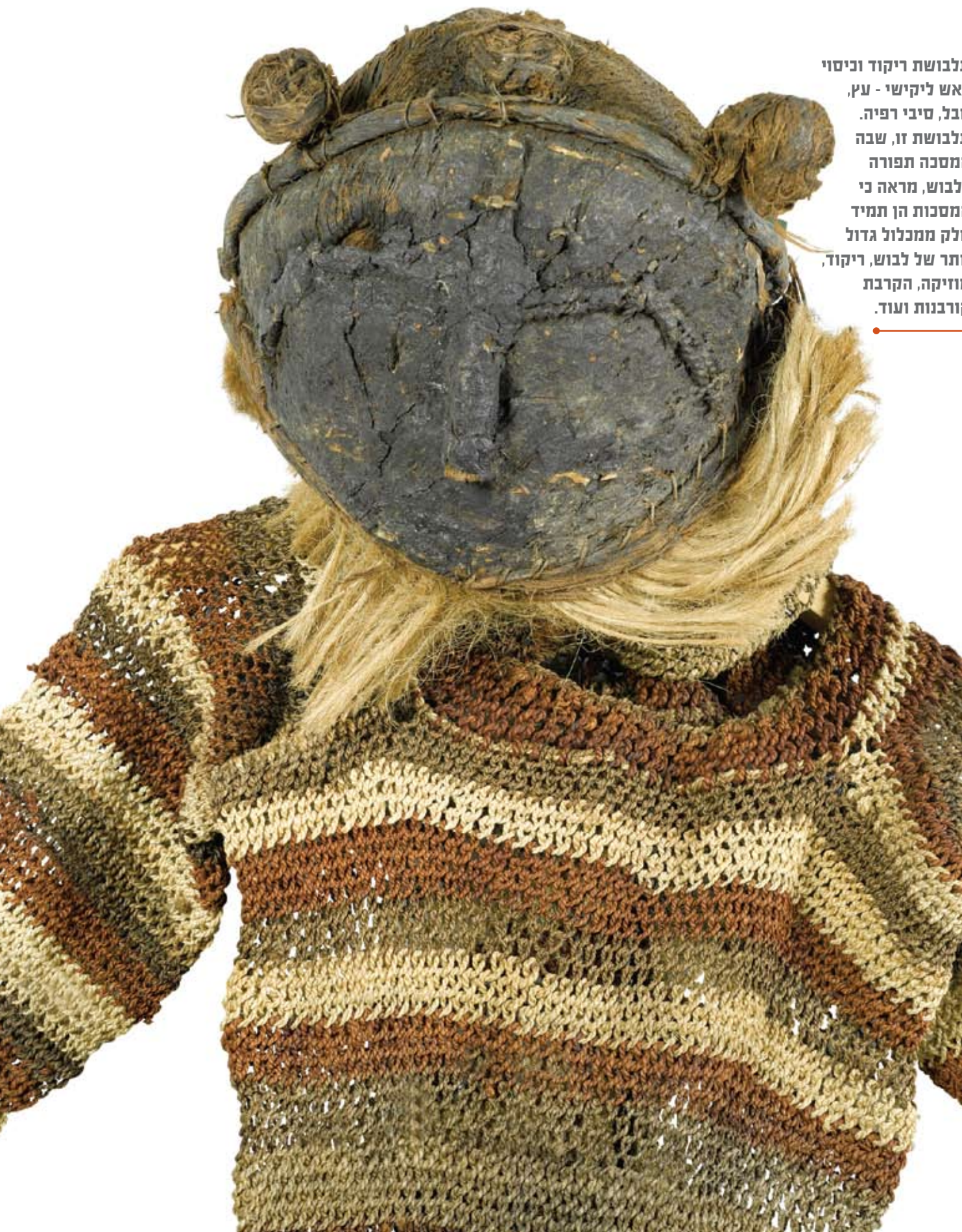
תלבושת ריקוד וכיסוי ראש ליקישי - עץ, חבל, סיבי רפיה. תלבושת זו, שבה המסכה תפורה ללבוש, מראה כי המסכות הן תמיד חלק ממכלול גדול יותר של לבוש, ריקוד, מוזיקה, הקרבת קורבנות ועוד.