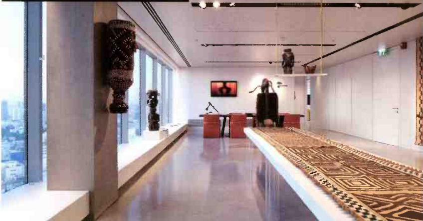
משרדי סטב אחזקות. "המחשבה הייתה על מצב דינמי. זה לא מצב של משרד שהחדרים בו נקבעו"

הפעילות האמנותית והמוזיקלית באפריקה מתקיימת בעשר השנים האחרונות על ידי סטיבה בשיתוף חיים טייב ובניהול נעמה מרגלית. "באנגולה ובכל כפר שבו שאנחנו נמצאים, גם בקונגו, יש מרכז כזה. הפעילות המרכזית היא בניית קהילות ואי אפשר לבנות קהילה רק סביב הבית והמגורים והאוכל והעבודה, צריך גם פעילות תרבותית. זה מחזק את הקהילה ואת המשפחה. זה מאפשר ביטוי גם לילדים וגם למבוגרים מחוץ למערכות הפורמליות".